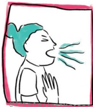
سخت شدن نفس کشیدن

خیلی از علائم کرونا شبیه آنفلوآنزا یا سرماخوردگی است که حتما قبلا چند بار گرفتی